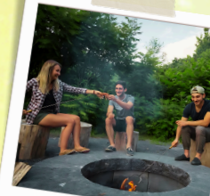
Feu (bois et papier journaux fournis)