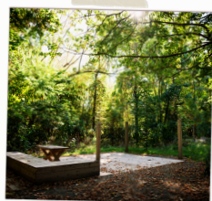
Sites pour tente sur plateforme