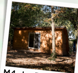
M4- Le Rustique