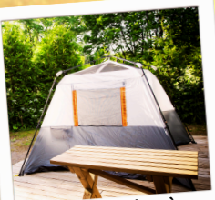
40 terrains à disposition