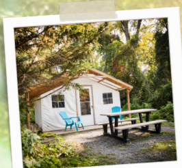
M1- Le Chasseur